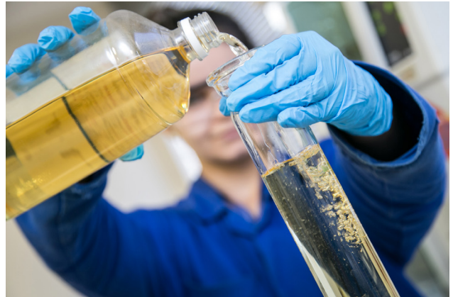
Etapa de desenvolvimento do sistema de filtração à base de material renovável para tratamento de águas oleosas.