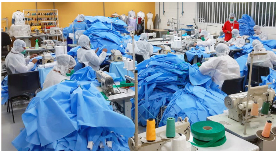
Firjan apoiou empresas para exponenciar fornecimento de itens hospitalares para combate à pandemia.