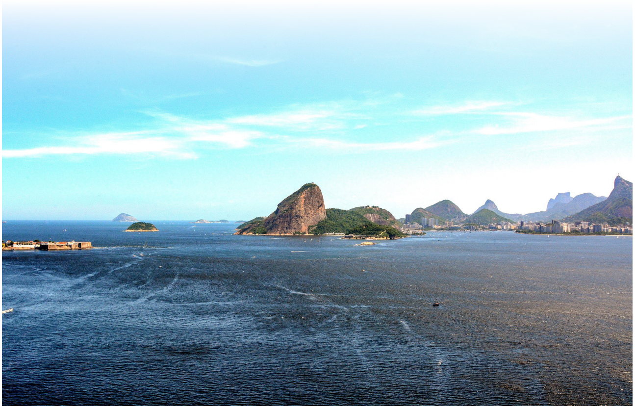
Baía de Guanabara.