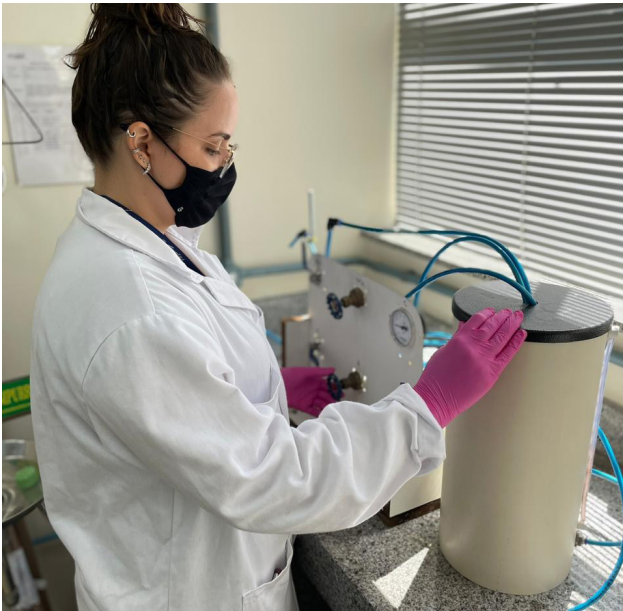
Técnica trabalha no projeto de ultrafiltração para purificação de água.