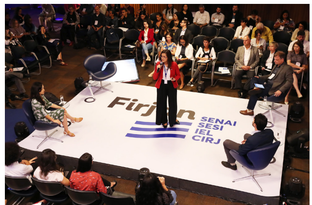
Ação Ambiental 2019 pautou soluções sustentáveis para a Baía de Guanabara a partir dos ODS.