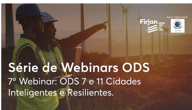
Material de divulgação

da pelos ODS. A Trilha ODS, que contou com o apoio institucional da Rede Brasil do Pacto Global, disseminou conhecimento e engajou as empresas na Agenda 2030 por meio da plataforma YouTube, e com acesso livre. Foram abordados os ODS 2, 3, 6, 7, 8, 9, 11 e 16, com 3 mil visualizações até o fechamento deste relatório.