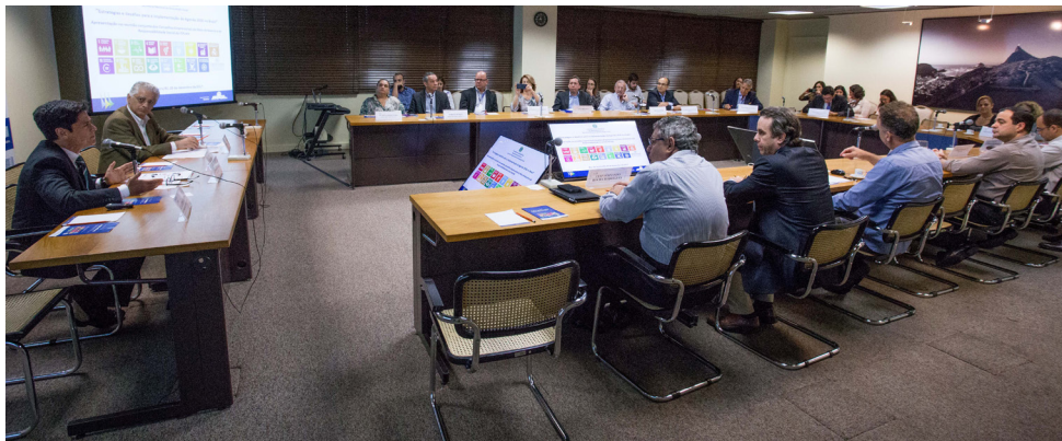
Reunião conjunta de encerramento das atividades de 2018 dos Conselhos de Meio Ambiente e Responsabilidade Social.