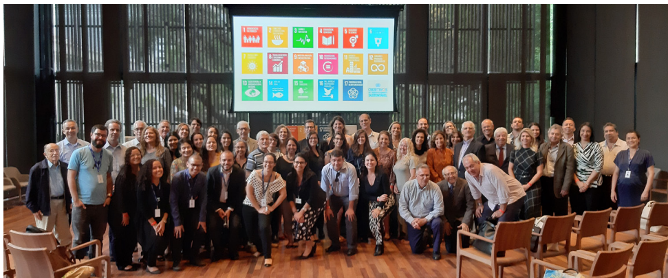
Conselhos de Responsabilidade Social e de Meio Ambiente e equipe de Sustentabilidade da Firjan recebem a Rede Brasil do Pacto Global para encerramento de 2019.

previstas para 2021, estão baseadas em iniciativas que favoreçam a compreensão e o gerenciamento de impactos de forma efetiva e transparente, principalmente nas empresas que compõem o encadeamento produtivo fluminense. Em uma perspectiva mais ampla, os resultados alcançados poderão impactar positivamente na competitividade e gestão de riscos, além de contribuir para o alinhamento da atuação empresarial com os ODS.