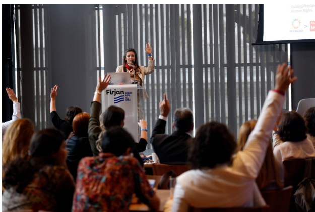
Workshop Critérios de Sustentabilidade na Cadeia de Valor reuniu mais de 80 participantes em 2019 na Casa Firjan.