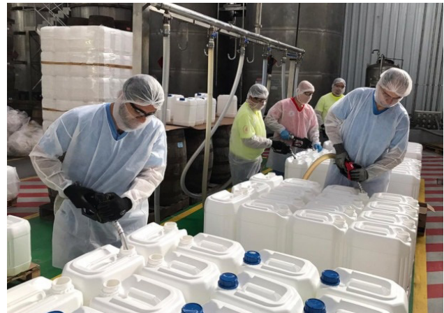
Envasamento de álcool em gel para doação à rede pública de saúde fluminense.