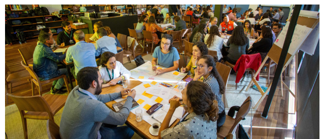
Workshop do Oásis Lab para cocriação de soluções baseadas na natureza, realizado em 2019 na Casa Firjan.