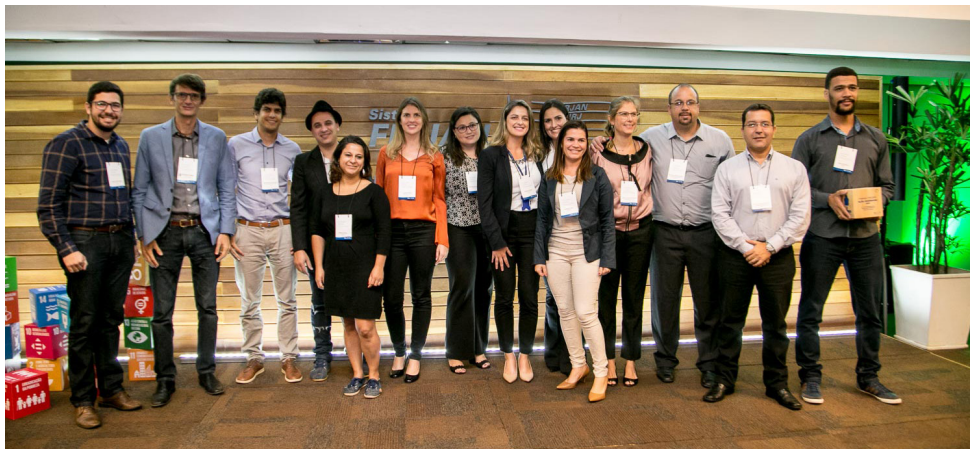
Empresas vencedoras do Prêmio Firjan Ambiental 2018, edição com o tema "Importância dos ODS na Estratégia de Negócio".