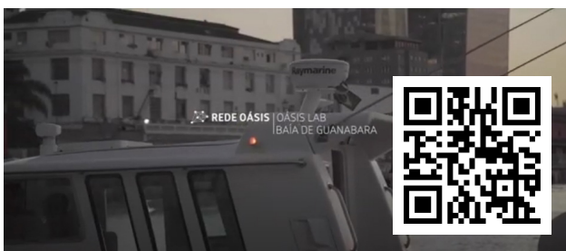
Oásis Lab Baía de Guanabara. Clique e assista ao vídeo.