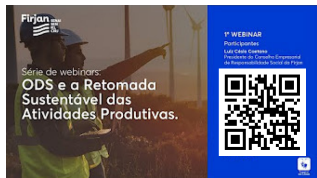
Série de Webinars | ODS e a retomada sustentável das atividades produtivas. Clique e acesse a playlist da série.